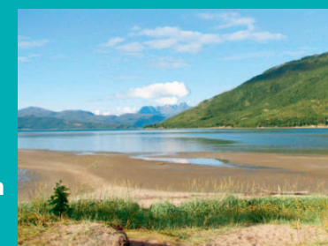
Badeplassen på Kvænnestua

Fra Storslett sentrum følger du E6 ca. 1,5 km nordover. Avkjørselen til Kvænnestua er på venstre side av veien og er merket med skilt. Det er en parkeringsplass ved startpunktet. I sommerhalvåret er det mulig å kjøre ca. 1 km lenger ned.