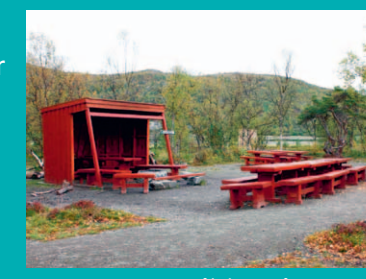
Bål plass på Kvænnestua

På Kvænnestua er det en løype på ca. 1,3 km som er universelt utformet. Det betyr at alle kan nyte dette friluftsområdet. Området inneholder videre et stort nett av andre stier, gapahuker, bålplasser, toalett og klatrepark.