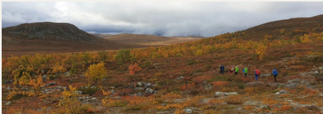
På tur over vidda i Reisa nasjonalpark.

Den europeiske parkdagen 24. mai 2026 markerer både naturens egenverdi og betydningen av samarbeid på tvers av grenser. Samtidig starter markeringen av at Reisa nasjonalpark fyller 40 år – et jubileum som løfter fram området sine unike verdier, betydningen av sammenhengende natur og behovet for felles innsats for å ta vare på den i møte med framtidige utfordringer.