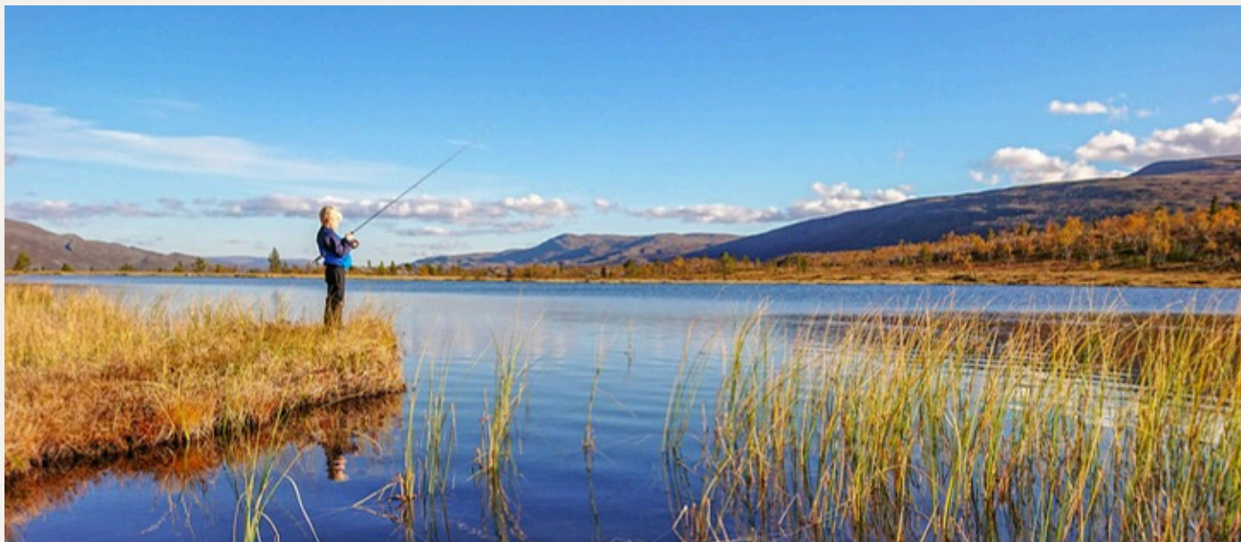
Fiske på Ørretvannet.

Reisa nasjonalparkstyre har over tid utviklet et godt samarbeid med finske myndigheter, særlig gjennom Metsähallitus, som forvalter store tilgrensende naturområder. Sammen er det bygget partnerskap og nettverk som styrker forvaltningen på begge sider av grensen. Sertifiseringen gjennom Europarc sin TBA-ordning (Transboundary Areas) er et konkret uttrykk for dette samarbeidet, og bidrar til bedre forvaltning, brukerorientering og erfaringsutveksling.