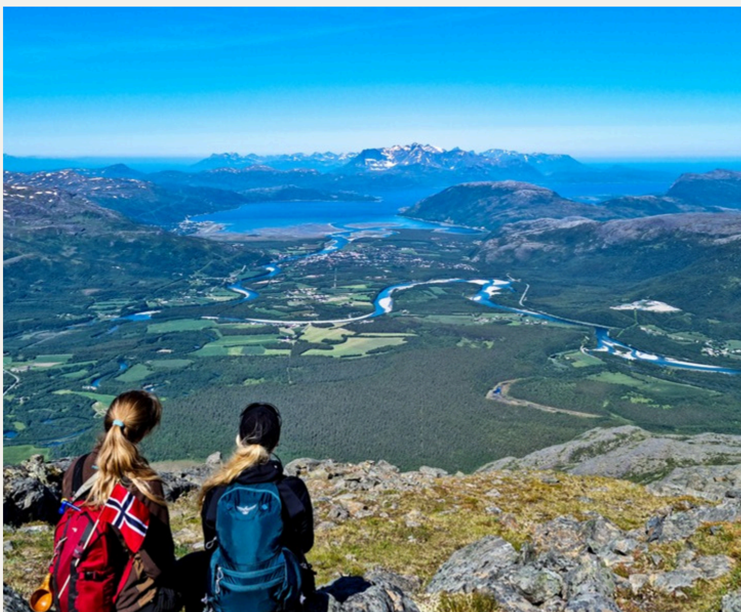
På tur i Nordreisa nasjonalparkkommune med utsikt mot Storslett nasjonalparkslandsby.

Årets tema er «Naturen forener oss». Temaet setter søkelys på hvordan naturen henger sammen på tvers av grenser og forvaltningsnivå, og hvordan økologiske sammenhenger, samarbeid og fellesskap er avgjørende for å ivareta naturmangfoldet. Sunne økosystemer eksisterer ikke isolert – de er avhengige av sammenhengende leveområder, vandringsmuligheter for arter og helhetlig forvaltning. På samme måte er samarbeidet mellom mennesker, lokalsamfunn og land viktig for å sikre naturens framtid.